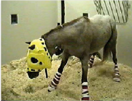
Horse affected by West Nile virus

De overdracht van het virus is seizoensgebonden en treedt voornamelijk op van juli t/m oktober in overeenstemming met de kenmerkende piekactiviteit van muggen.