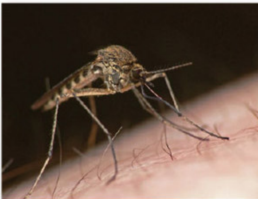
West Nile virus is also a risk to people

Er zijn 24 muggesoorten die het virus kunnen overbrengen. 8 van deze